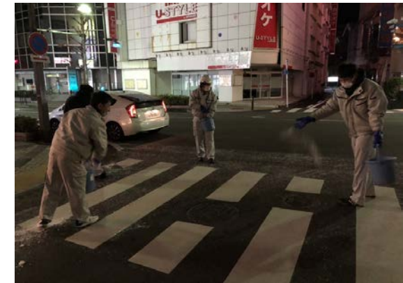
(凍結防止剤の散布)

まちづくり 創業以来公共工事を中心に、道路・橋梁・公共施設の建設/整備/補修を行っています。 また、藤沢市建設業協会会員として、藤沢市との協定のもと、地震・豪雨等の災害時に復旧活動を行い、安心して暮らせるまちづくりを目指しております。